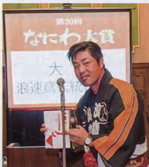
NPO 法人 浪速鳶伝統保存会