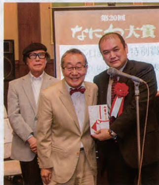
うめだ印刷株式会社「ココノ」