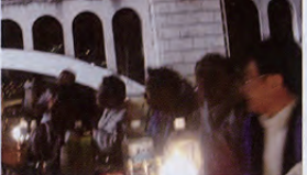
▲アッという間に接近。約2時間の探検クルーズを楽しみました。