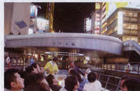
▲まもなく「戎橋」の下を通過。