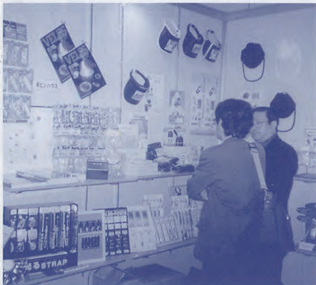
「なにわ名物開発研究会」出展ブース

今回は会員十一社が参加し、研究会認定商品や、各企業の商品PR、参加企業のPRを行いました。またフェスタ参加企業・団体のPRプレゼンテーションを二百六十人収容の会場で行え